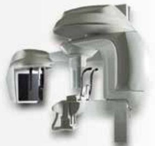
NUEVA TECNOLOGÍA DIGITAL INCORPORADA

Solicitar turno al Tel.: 4901-5488/4903-4343 - interno 116 - Tel. directo: 4902-0171 CONSULTE POR NUESTROS VALORES INSTITUCIONALES Eduardo Acevedo 54 - C.A.B.A.